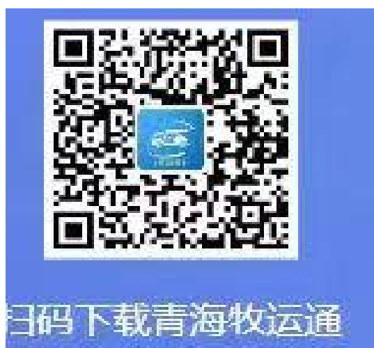
手机 APP 二维码