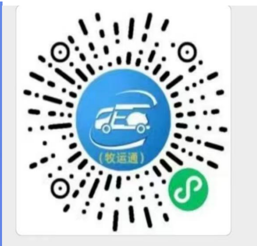
微信小程序二维码